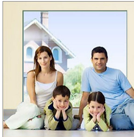
МДОБУ Детский сад № 5 «Радуга» г. Урюпинск

«Чем больше у ребенка свободы, тем меньше необходимость в наказаниях. Чем больше поощрений, тем меньше наказаний» (Я.Корчак)