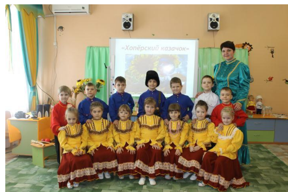
Творческий конкурс «Эх, казачата»