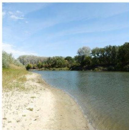
Фотоконкурс «У руба на Хопре»