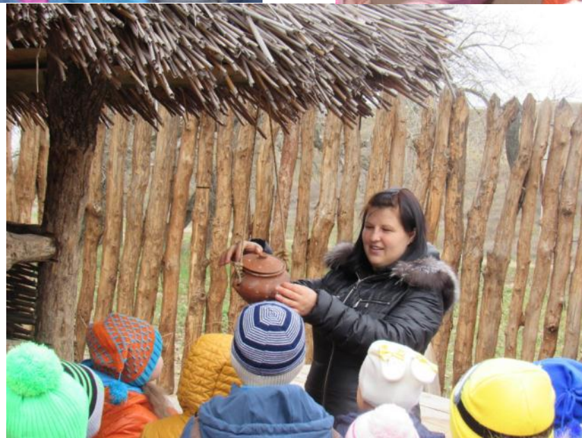
Экскурсия в Левыкинский городок