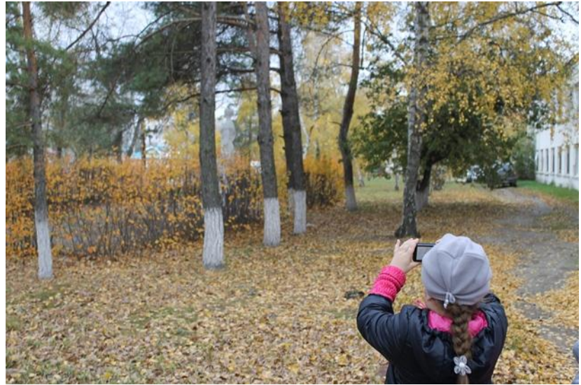
«Экскурсия по родному городу»