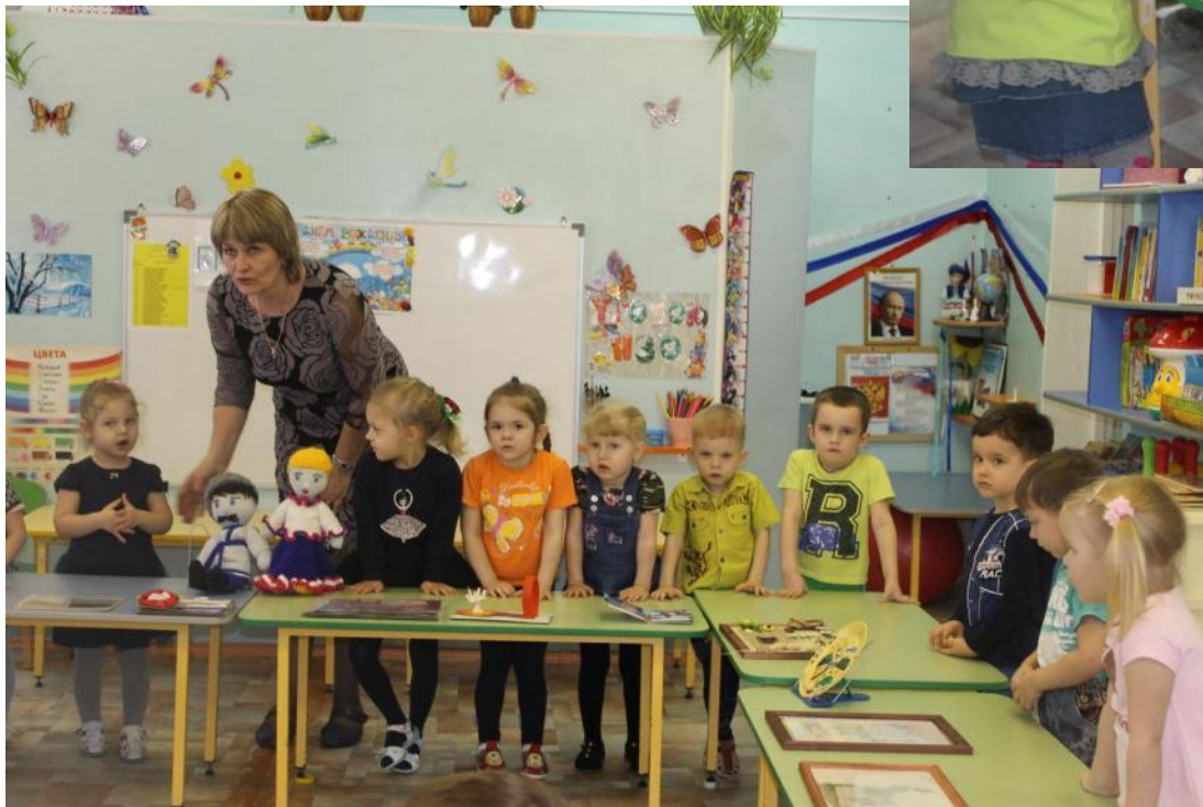
Выставка творческих работ «Достопримечательности города Урюпинска»