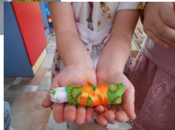
Изготовление народной куклы Прихопёрья «Пеленашки»