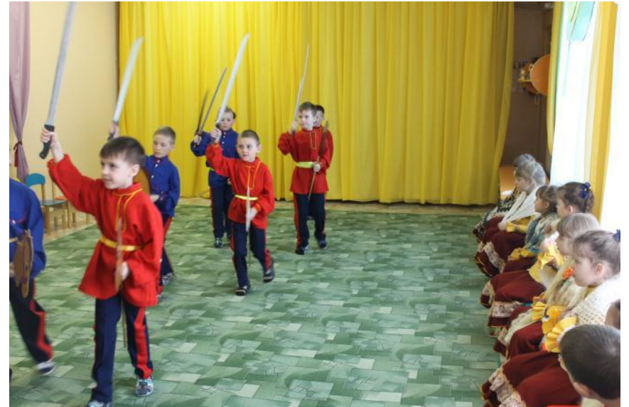
Развлечение «Хоперские вечёрки»